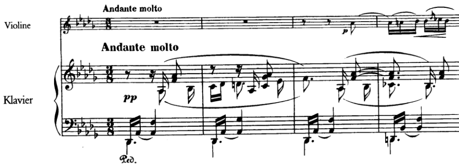
Şekil 1. Clara Schumann Drei Romanzen für Violine und Klavier Op. 22 Piyano arpej dokusu

Şekil 1’deki açılıшта dikkat çeken bir diğer unsur, armonik hareketin belirgin kadans noktalarıyla kesilmemesidir. Aksine, armonik değişimler çoğu zaman dokusal süreklilik içinde “eriyerek” ilerler. Bu durum, müziğin lineer bir ilerleyişten ziyade, akışkan bir yüzey üzerinde geliştiği izlenimini yaratır. Piyano burada yalnızca bir eşlikçi değil, adeta zamanın kendisini şekillendiren bir unsur hâline gelir. Kemanın giriş noktası, bu bağlamda ayrı bir önem taşır. Yaklaşık beşinci ölçü civarında gerçekleşen bu giriş, dramatik bir vurgu ile değil, hâlihazırda kurulmuş olan dokusal alanın içinden yükselen bir vokal jest olarak ortaya çıkar. Melodik çizginin başlangıcı, keskin bir sınır çizmek yerine, süreklilik içinde belirir; bu da eserin anlatısal karakterini baştan itibaren belirler.