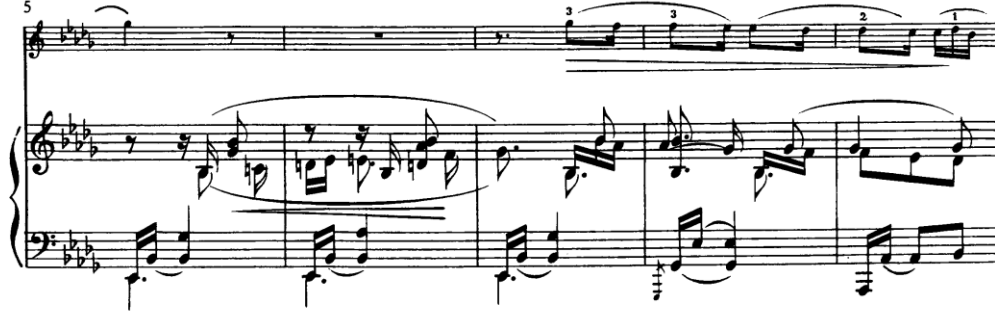
Şekil 2. Clara Schumann Drei Romanzen für Violine und Klavier Op. 22 Kemanın ilk lirik cümlesi

şekillendiren aktif bir katman olarak öne çıkar. Arpej dokusu, yalnızca armonik bir temel sağlamla kalmaz, aynı zamanda kemanın çizgisine paralel bir hareket duygusu yaratarak, iki enstrüman arasında sürekli bir etkileşim kurar. Bu etkileşim, eserin başından itibaren eş-özne (co-agency) bir yapı oluşturduğunu gösterir. Şekil 2’ de keman, anlatının öncelikli taşıyıcısı gibi görünse de, bu ifade, piyano tarafından kurulan dokusal ve zamansal çerçeve olmaksızın anlamını yitirir. Bu nedenle burada söz konusu olan, hiyerarşik bir yapıdan ziyade, karşılıklı bağımlılığa dayalı bir ilişki modelidir.