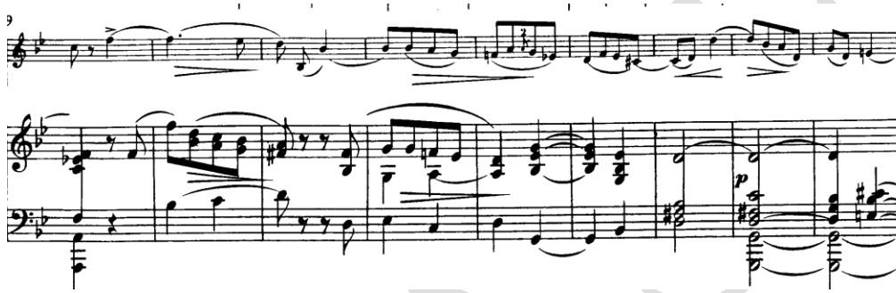
Şekil 4. Clara Schumann Drei Romanzen für Violine und Klavier Op. 22 Varyasyon görünümülü lirik çizgi

Bu bölümün başlangıcında Şekil 4'te görülen keman çizgisinin; açılışta duyulan lirik yönelimi koruduğu, ancak ritmik açıdan daha esnek ve yer yer daha serbest bir karakter kazandığı gözlemlenir. Bu esneklik, müziğin belirli bir yön duygusuna sabitlenmesini engeller; aksine, ifade sürekli olarak yeniden şekillenir.