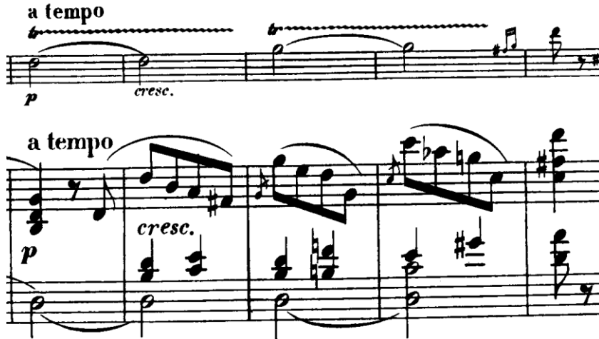
Şekil 8. Clara Schumann Drei Romanzen für Violine und Klavier Op. 22 Jest kırılması

Piyano partisi bu süreçte daha yoğun bir rol üstlenir. Armonik geçişler daha belirgin hâle gelir ve dokusal hareketlilik artar. Şekil 9’ da özellikle alt ve orta seslerdeki hareketler, kemanın parçalı çizgisine karşılık veren bir yapı oluşturur. Bu karşılıklı etkileşim, müziğin gerilim düzeyini artırır. Bu bölümde dikkat çeken bir diğer unsur, açılış materyalinin izlerinin yeniden ortaya çıkmasıdır. Ancak bu geri dönüş, birebir bir tekrar niteliği taşımaz; önceki dönüşümler, bu materyalin algılanışını değiştirmiştir. Bu tür geri dönüşler, romantik müzikte sıklıkla “anımsama” işleviyle ilişkilendirilir (Todd, 2004, s. 158).