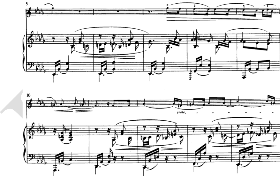
Şekil 3. Clara Schumann Drei Romanzen für Violine und Klavier Op. 22 Piyano iç ses hareketleri ve keman ilişkisi

Açılış bölümünün ilerleyen ölçülerinde, melodik materyalin küçük değişimlerle tekrarlandığı görülür. Ancak bu tekrar, klasik anlamda bir periyot tamamlanması değil, daha çok ifadenin hafifçe genişletilmesi şeklinde ortaya çıkar. Şekil 3’de ritmik esneklik korunur, ancak armonik zemin ve iç ses hareketleri, aynı materyalin farklı bir ışık altında algılanmasına neden olur. Oda müziğinde olduğu gibi enstrümanlar arasındaki ilişki, sabit rollerden ziyade, icra sırasında sürekli yeniden tanımlanan dinamik bir etkileşim alanı oluşturur (Leech-Wilkinson, 2009, s. 73).