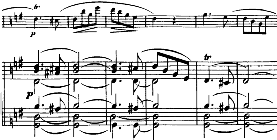
Şekil 9. Clara Schumann Drei Romanzen für Violine und Klavier Op. 22 Yoğun piyano dokusu

Piyano partisi bu süreçte daha yoğun bir rol üstlenir. Armonik geçişler daha belirgin hâle gelir ve dokusal hareketlilik artar. Şekil 9’ da özellikle alt ve orta seslerdeki hareketler, kemanın parçalı çizgisine karşılık veren bir yapı oluşturur. Bu karşılıklı etkileşim, müziğin gerilim düzeyini artırır. Bu bölümde dikkat çeken bir diğer unsur, açılış materyalinin izlerinin yeniden ortaya çıkmasıdır. Ancak bu geri dönüş, birebir bir tekrar niteliği taşımaz; önceki dönüşümler, bu materyalin algılanışını değiştirmiştir. Bu tür geri dönüşler, romantik müzikte sıklıkla “anımsama” işleviyle ilişkilendirilir (Todd, 2004, s. 158).