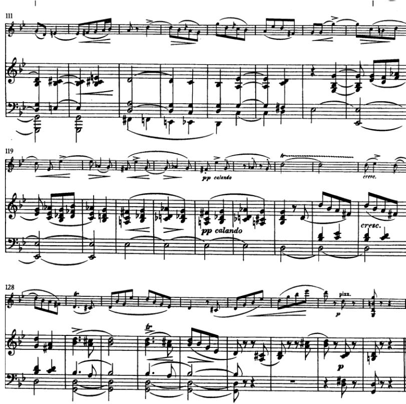
Şekil 10. Clara Schumann Drei Romanzen für Violine und Klavier Op. 22 Kademeli çözülme ve son

Kapanış sürecinde, belirgin bir kadans yerine kademeli çözülme dikkat çeker. Piyano dokusu incelik, kemanın çizgisi ise kesin bir sonuç hissi vermeden sönümlenir. Bu durum, eserin başında kurulan akışkan zaman anlayışının sonuna kadar korunduğunu gösterir. Bu kapanış biçimi, eserin başından itibaren kurulan akışkan zaman anlayışıyla tutarlıdır. Müzik, kapalı bir yapı olarak tamamlanmak yerine, dinleyici algısında devam eden bir izlenim bırakarak sona erer. Bu özellik, küçük form içerisinde kurulan anlatının, yalnızca başlangıç ve sonuç üzerinden değil, süreç odaklı bir deneyim olarak ele alınması gerektiğini göstermektedir.