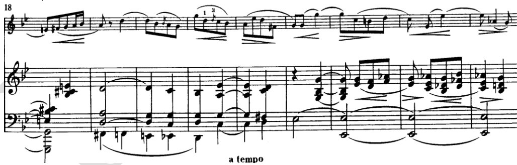
Şekil 5. Clara Schumann Drei Romanzen für Violine und Klavier Op. 22 Piyano iç ses hareketleri

Piyano partisi bu aşamada daha belirgin bir rol üstlenir. Açılışta daha homojen bir akış sunan arpej dokusu, Şekil 5' de iç ses hareketleri aracılığıyla daha karmaşık bir hâl alır. Özellikle orta seslerdeki küçük yön değişimleri, kemanın çizgisine paralel bir ifade katmanı oluşturur. Böylece piyano, yalnızca zemini kuran değil, ifadenin yönünü aktif biçimde etkileyen bir unsur hâline gelir.