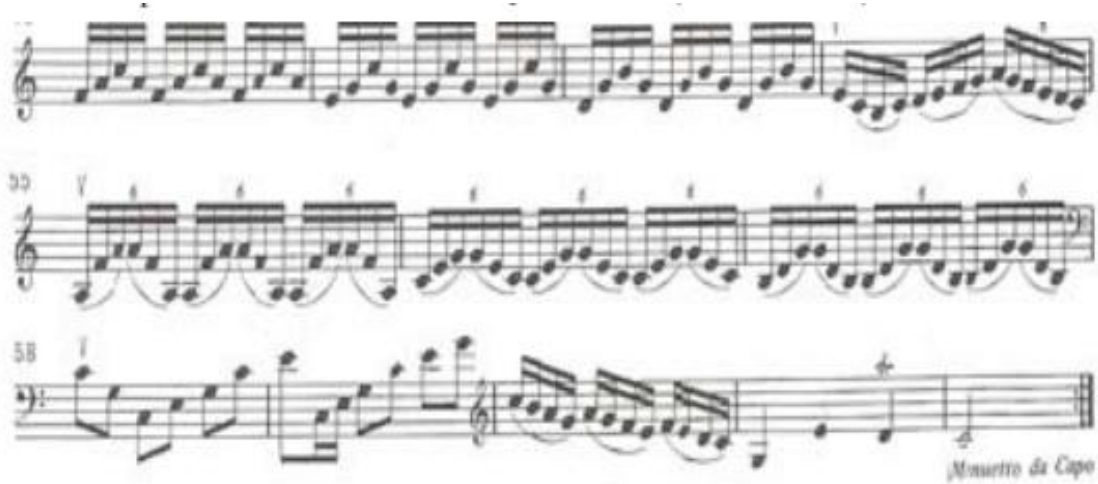
Görsel 3. Hoffmeister: Solo Kuartet No. 2 Bölüm 2, ölçü 51-62 24

Hoffmeister'in No. 2 Re Majör Kuarteti dönemin özelliklerini göstermektedir. Hoffmeister'in birinci kemanın rolünü kontrbasa verdiği dört kuartet bulunmaktadır. Bu eserlerin teknik pasajları Viyana akordu ile çok daha kolay bir şekilde çalınabilmektedir. Bu sayede solo partiler çok daha açık ve rezonanslı duyulmaktadır. 23 (Bkz. Görsel 3)