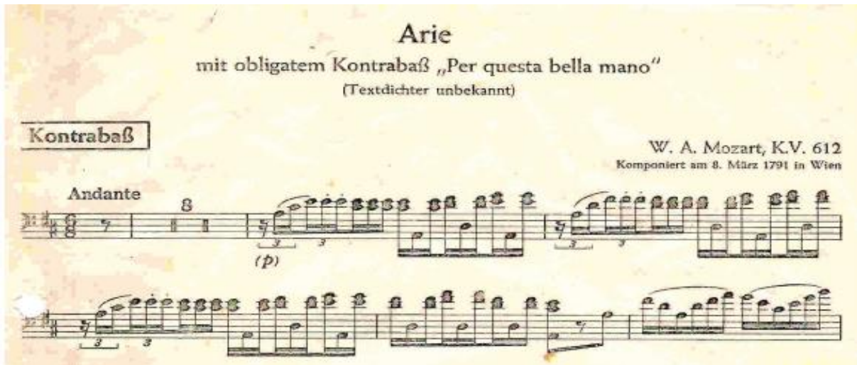
Görsel 1. Per Questa Bella Mano 19

Mozart'ın, on çalgıdan oluşan, bas, kontrbas ve orkestra için bestelediği “ Per Questa Bella Mano ” adlı eseri kontrbas için teknik pasajlar içermektedir (Bkz. Görsel 1).