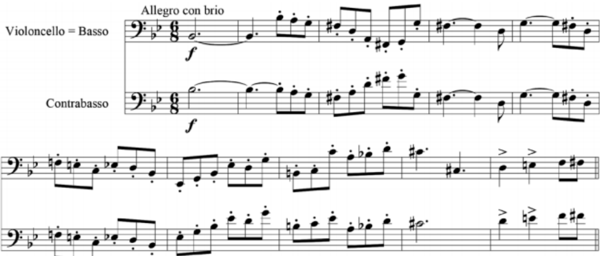
Görsel 3. 5. Onslow Kentet No. 11, Op. 33, Ölçü: 13-22, (ilk edisyon) Breitkopf&Hartel, 1827-1828. 36

George Onslow'un oda müziği eserleri Klasik ve Erken Romantik Dönem'de kontrbasın rolünü etkinleştirmiştir. 19. yüzyıl Fransa'sında 36 yaylı kuartet ve 34 yaylı kentet ile üretken bir isim olan George Onslow, eserlerinde daha çok Viyana geleneğini benimsemiştir. 37