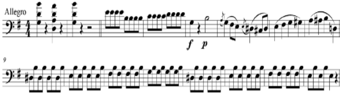
Görsel 2. Dittersdorf Kentet No.6 (1782) (Bir oktav tizleştirerek kontrbasa uyarlanmış viyolonsel partisi) 21

İtalya’da doğan ancak kariyerinin büyük bir bölümünü İspanya’da geçiren Luigi Boccherini, birçok eserinde kontrbasa yer vermiştir. Aynı zamanda viyolonselci olan bestecinin, “Viyolonsel ve Basso için Sonatlar” gibi bazı eserlerini kontrbas sanatçısı olan babası Leopoldo Boccherini için bestelediği düşünülmektedir. Özellikle senfoni ve konçerto gibi orkestral eserlerinde daima en kalın parti için basso ifadesini kullanmıştır. Bu ifade ile hangi çalgıların öngörüldüğü belirsizdir. Eserlerin modern edisyonları oda müziği repertuarında kontrbasçılar tarafından sıkça kullanılmaktadır.