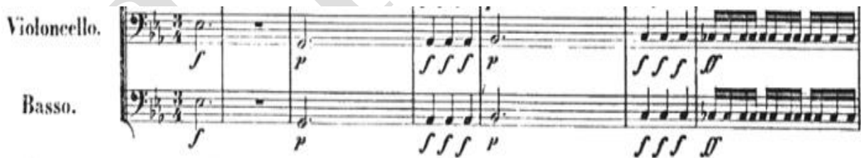
Görsel 4. Ludwig van Beethoven (1770-1827) Septet, Bölüm 1, Ölçü 1-7 26

Beethoven'ın klarnet, korno, fagot, keman, viyola, viyolonsel ve kontrbas için 1799 yılında bestelediği Septet Op. 20, kontrbaslı tek oda müziği eseridir. Eserde kontrbas partisi, viyolonsel partisini bir oktav aşağıdan katlamakta ve tematik kısımlarda viyolonsel ile armonik destek vermektedir (Bkz. Görsel 3.4). Zarif ve hafif bir divertimento türünde olan eser Beethoven'ın eserlerindeki tipik ciddiyeti ile harmanlanmış bir üsluba sahiptir. Beethoven'ın altı bölümlü eserinin üçüncü bölümü Tempo di Menuetto'nun temasını basılmamış Piyano Sonatı Op.49 No.2 eserinden almıştır. 25