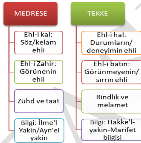
Şekil 2. Medrese ve Tekkenin tasavvuf yaklaşımı

Ancak bununla birlikte şeriat, tarikat ve hakikat noktasında kurum bazında iki temel zıtlık ortaya çıkmaktadır: Medrese ve tekke. Medreselerdeki âlimler, akli ve Allah’ın belirttiği kesin bilgileri esas alırken; tekkelerdeki sûfiler ise tarikat ve hakikat yolunu tercih etmekte, tefsir ve te’vil anlayışlarındaki farklılığa dayanan ihtilaflar ortaya çıkmaktadır (Köprülü, 2011: 152). Tasavvufta ilgili medrese ve tekke arasındaki ayrışmayı şematik olarak şu şekilde göstermek mümkündür: